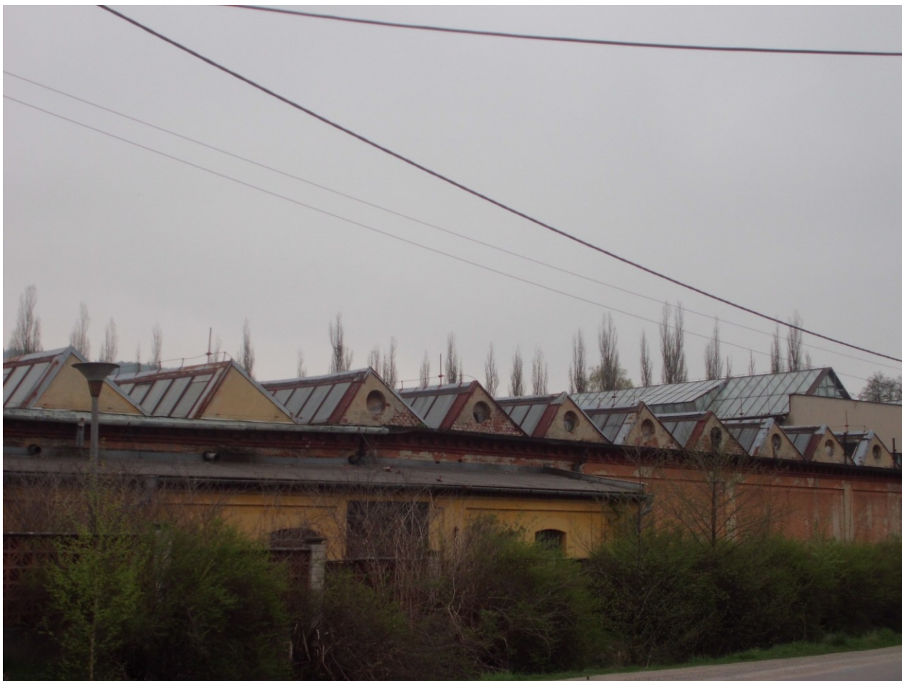
Obrázek 1: Prostory Schindlerovy továrny v Brněnci